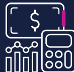
Kostenplanung- und Steuerung