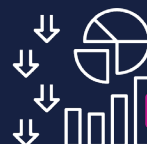
Ressourcen- und Risiko- management